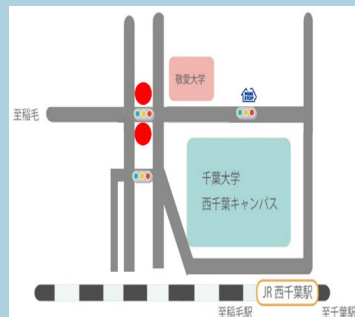
ちーあいふれあいの庭 上図 ● 参照

【持ち物】汚れてもよい服装／靴、軍手(必須)、シャベル(片手で扱えるもの)、帽子、水筒 ※日程は、変更になる場合がございます。雨天時は翌日に順延。