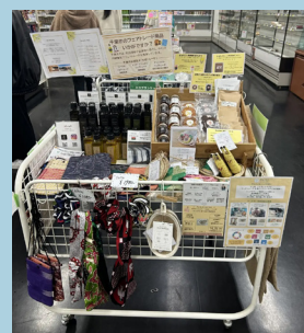
千葉大学内におけるフェアトレード商品の販売