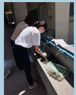
学生による エアコンフィルター 清掃の様子

エアコンを毎日使うのであれば、 2週間に1回 の目安でフィルターを清掃するのがおすすめです。フィルターを清掃し、今年の夏を快適に過ごしましょう。