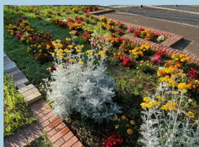
前回の花植えイベントの様子

私たち大学生と一緒に街を彩りませんか？ 未経験でも大丈夫です！私たちと一緒に花植えを楽しみましょう！