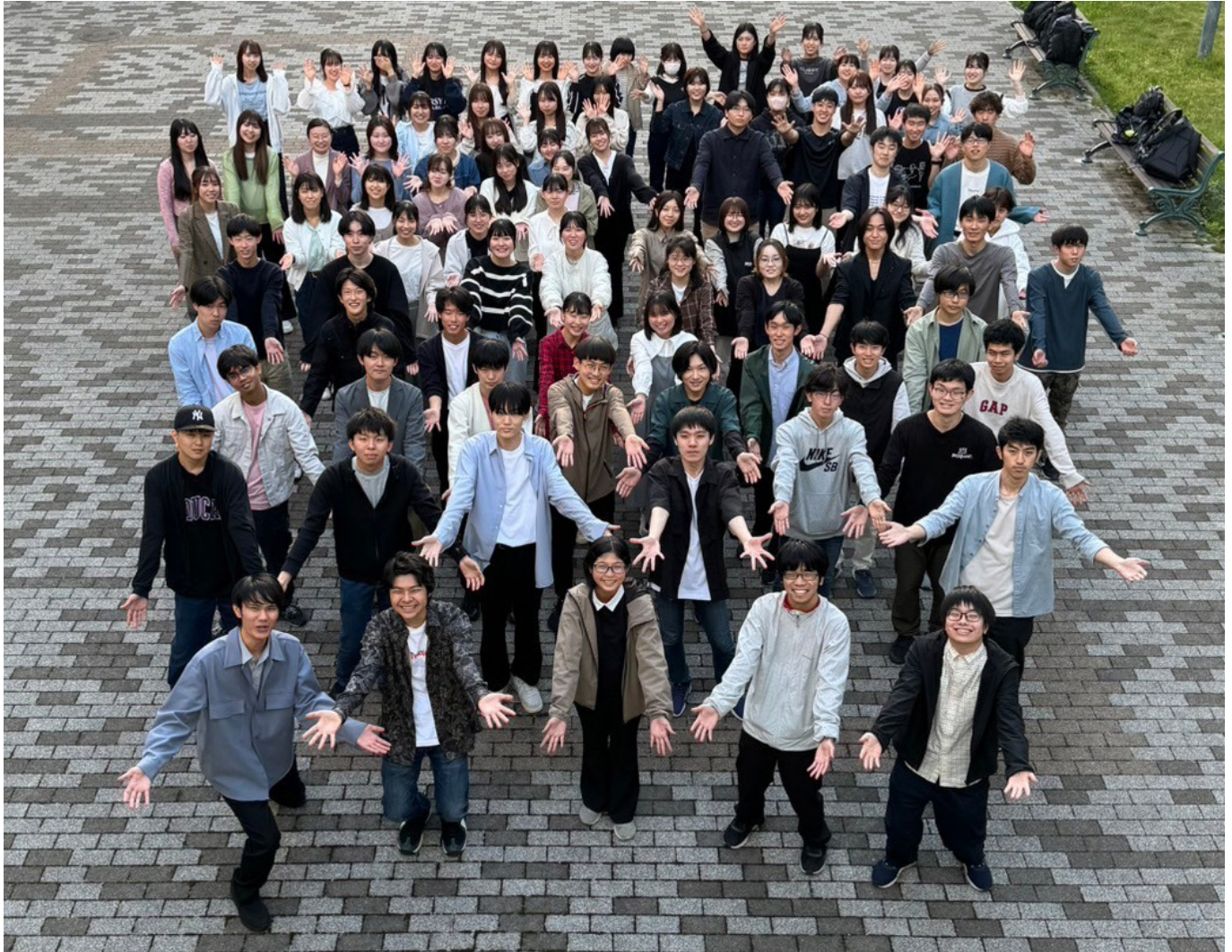
千葉大学環境 ISO 学生委員会 集合写真。新年度にたくさんの若き 1 年生たちが集まりました！