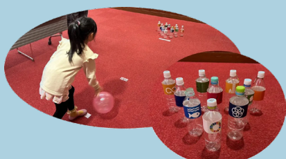
ボウリングイメージ

ボウリングやゲームを通じて楽しくSDGsを学んだり、トイレトペーパーの芯やペットボトルキャップ、牛乳パック、古着などの身近なものをを用いた工作からエコを体験したりすることで、子どもたちのSDGsの理解促進やエコ意識を育むイベントです。