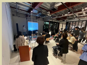
人権問題に関する 映画上映会の様子

ダイバーシティ班では、LGBTQ + セミナー開催等で多様性に関する知識や考え方を広めました。環境班では、「土に還る服」に着目し、関連企業への取材を行いました。人権班では、THE BODY SHOP や Nudie Jeans などのフェアトレード企業への取材や、人権問題に関する映画上映会を開催し、ファッション業界の人権問題に光を当てました。文化班では、西千葉の街をアートで彩る創造的なプロジェクトを計画しました。