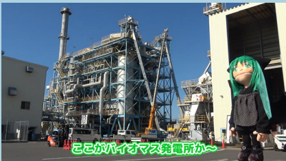
バイオマス発電編