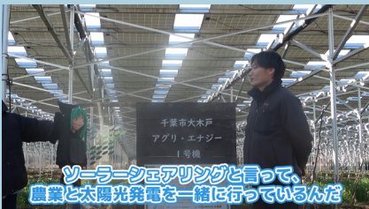
ソーラーシェアリング編

動画では、ソーラーシェアリング、地中熱利用、洋上風力発電など、最近話題の様々なトピックについてわかりやすく解説しています。 みなさんもぜひ動画を見てみてください！