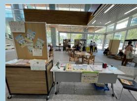
フェアトレードイベント参加時の様子

今年度からは、「フェアトレードプロジェクト」として独立してより柔軟・大規模に企画運営を行い、千葉大生を対象としたフェアトレード企画の運営や千葉市フェアトレード推進グループ主催のイベントへの参加を通して、“千葉大生として出来る”フェアトレード啓発や千葉市のフェアトレードタウン認証取得の後押しを行って参ります。