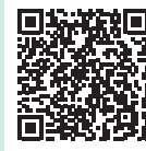
動画一覧 (YouTube プレイリスト)